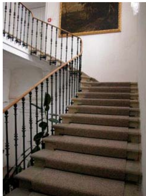
Klasicistní schodiště původního Terschova domu. Foto J. Mašek, 2006.

V přízemí napravo od vstupu je trojice sálů, z nichž jeden má strop, okna i dveře dekorativně obloženy dřevem. Z původního mobiliáře je zde novorenesanční, bohatě vyřezávaná kredenc. Z vybavení interiérů zůstalo velice málo předmětů, ale dle bohatě zdobené fasády doplněné plastikami, lze předpokládat i exkluzivní vnitřní vybavení, doplněné uměleckými díly. Dochoval se jich jen zlomek, například litinová socha Tance na schodišti nebo několik secesních svítidel. Z vybavení parku zůstala ve sbírkách muzea kovová socha Žně z fontány před palácem. Nárožní sály v patře včetně arkádové galerie převyšují výšku stropů ostatních místností v poschodí. Sály jsou zaklenuty "falešnou" zrcadlovou klenbou bohatě